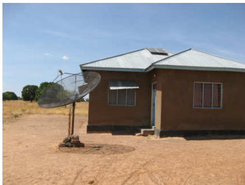
Solcell som ger ström till TV och ett klassrum.