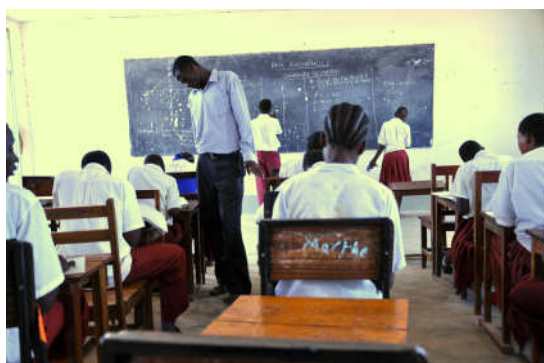
Fler lärare, skolavgifter för elever och skollunch.