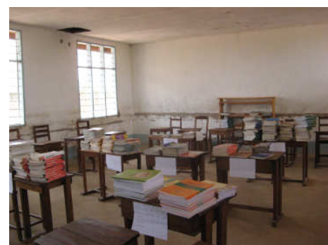
Läroböcker och skönlitteratur.