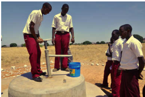
Friskt och rent dricksvatten