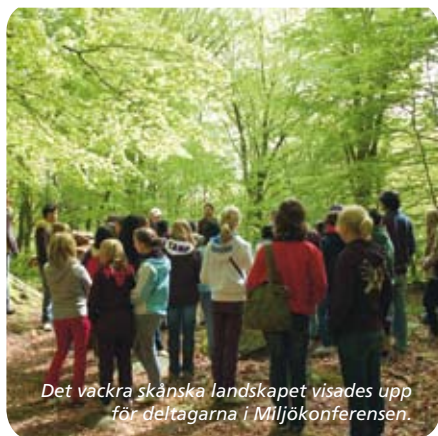
Det vackra skånska landskapet visades upp för deltagarna i Miljökonferensen.

Eftersom miljöfrågor är något som engagerar Staffanstorps kommun, föll det