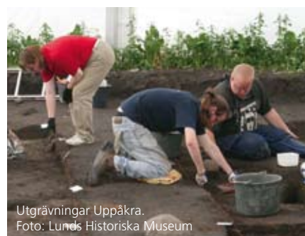
Utgrävningar Uppåkra.

Att utvidga besöksnäringen är en del av strategin för att få handeln att blomstra.