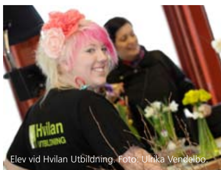
Elev vid Hvilan Utbildning.

i parkerna. Projektet har bland annat lett till en ny rondell vid City Gross, ombyggnad av Bråhögsplassen och av rondellen vid Malmövägen/Västanvägen samt upprustning av motionsspåret vid Gullåkra Mosse. Vid flera torg och gator genomförs nyplanteringar av träd, buskar och perenner. Belysningen har på flera ställen kompletteras med effektbelysning. Ur trygghetssynpunkt rensas buskage längs gång- och cykelvägar.