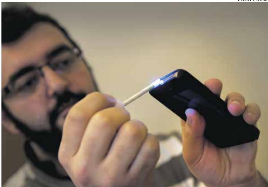
MärkDNA är en syntetisk vätska som man ”duttar” på sina värdeföremål så att de får sin egen spårbara identitet. Därmed blir inte föremålet lika stöldbegärligt.

Polisen har valt Staffanstorps kommun som startplats för märkDNA av flera skäl. – Ert geografiska läge mellan Malmö och Lund med genomfartsleden 108 och nära motorvägssystemet, er typografiska