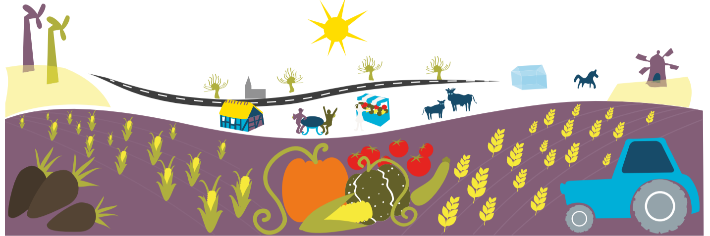
Illustration: Alva Esping

Första helgen i september är det dags för något helt nytt – den stora Skördehelgen.