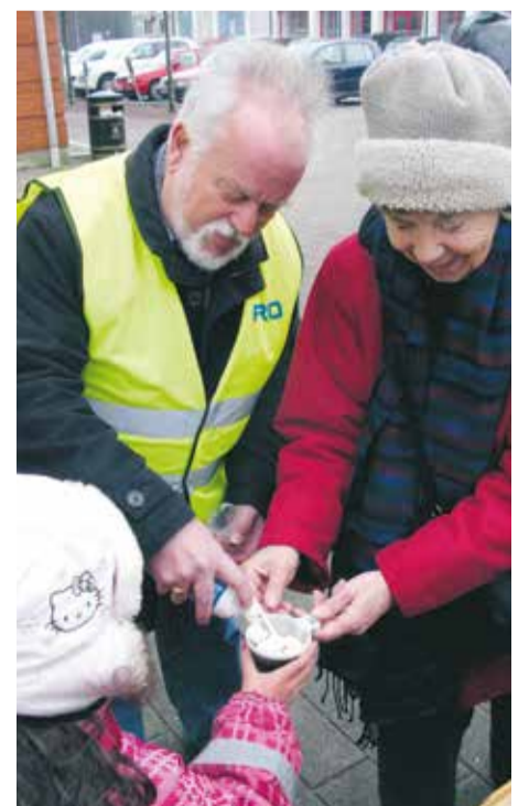
PRO och SPF bjuder på gratis varm choklad.