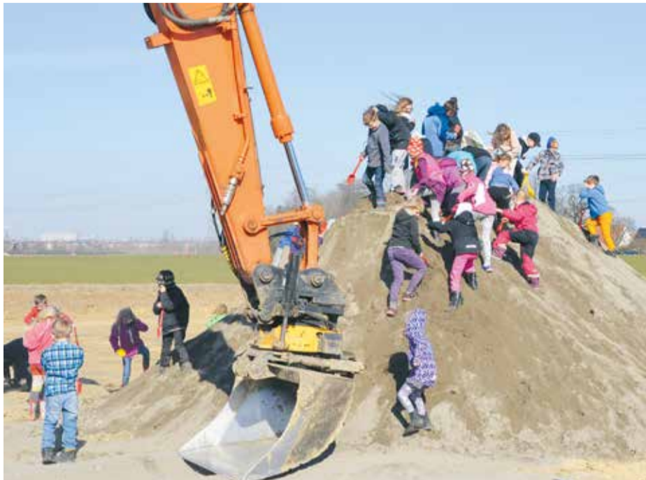
Ett 40-tal skolbarn från Hjärups Montessoriskola fick spontant ta de historiska första spadtagen för nya Uppåkraskolan.

– Vi har utedag varje onsdag och idag visste vi att detta skulle ske, så vi sa till barnen att idag ska vi