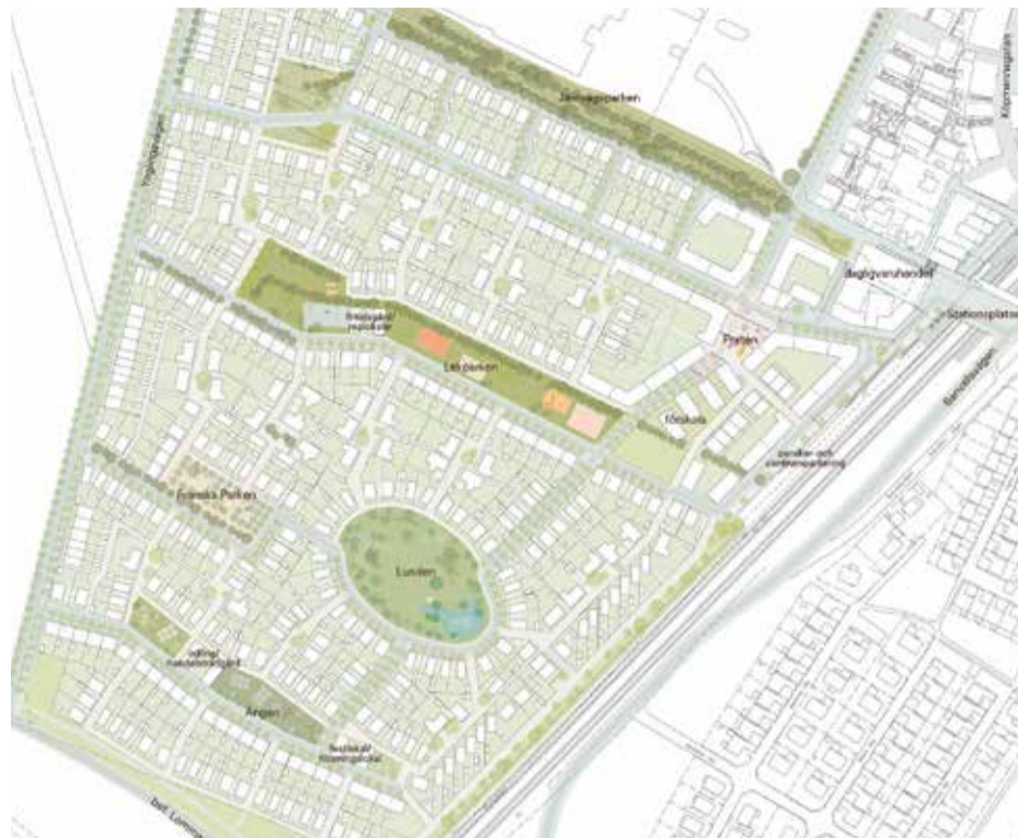
Illustration: Gehl Architects

– Vi tillför mycket av det som saknas i Hjärup i dag i form av service och handel. Tajmingen är perfekt eftersom detta sker parallellt med att Trafikverket bygger fyra spår genom Hjärup. – Vi tänker mångfald, vi vill ha en blandad upplåtelseform. Det blir både bostadrätter, hyresrätter och äganderätter. Radhus och kedjehus i de västra delarna