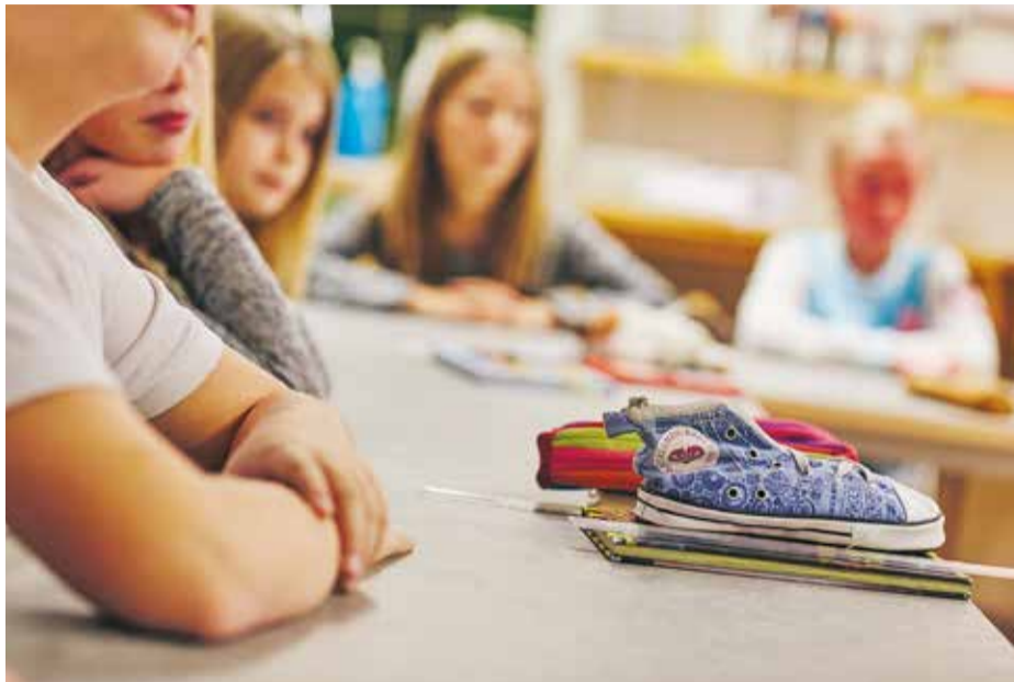
Barnen på bilden har inget med texten att göra.

Staffanstorps kommun har sedan några år tillbaka tagit ett stort och viktigt helhetsgrepp kring skolan i Staffanstorp. Baldersskolan har genomgått en rejäl ansiktslyftning. Mellanvångsskolan är idag en helt nybyggd skola. I Hjärup byggs just nu den nya Uppåkraskolan samt en helt ny förskola.