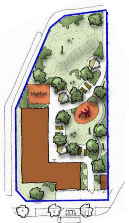
Illustration: Era landskap

Den nya förskolan beräknas vara klar till sommaren 2016. Den kommer att kunna bereda plats för barnen från Åkervin-dans förskola som tillfälligt, fram till nästa sommar, kommer att vara i paviljonger i anslut-ning till Hjäruvs skola.