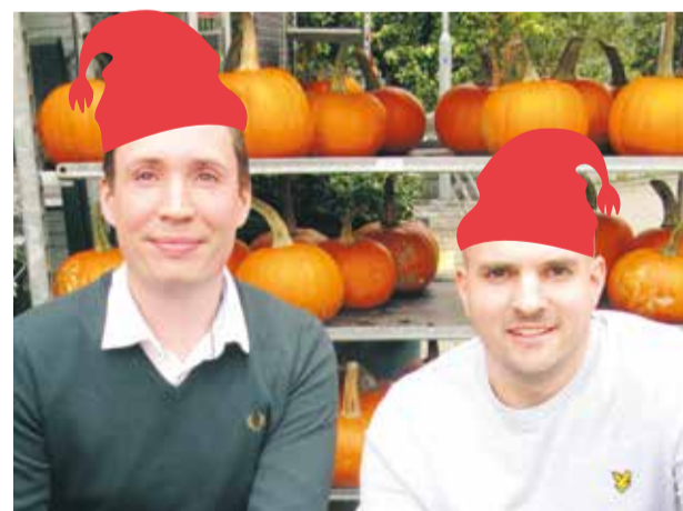
Matgästen i fokus Kostsektionen arbetar ständigt med för- bättringar → 6