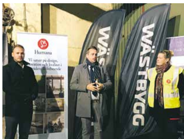
Nytt äldreboende på gång I mitten av november togs det första spadtaget till boendet i Sockerstan → 4