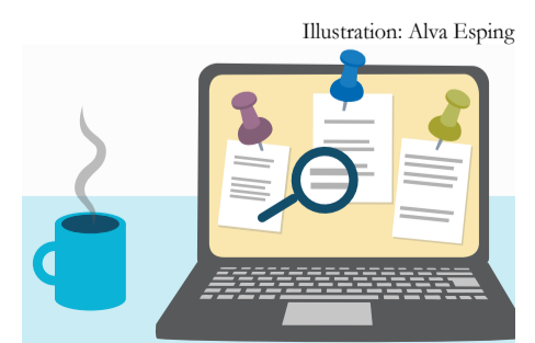
Illustration: Alva Esping

blir i fortsättningen utgångspunkt för beräkning av tiden för överklagande för fullmäktiges och nämndernas beslut.