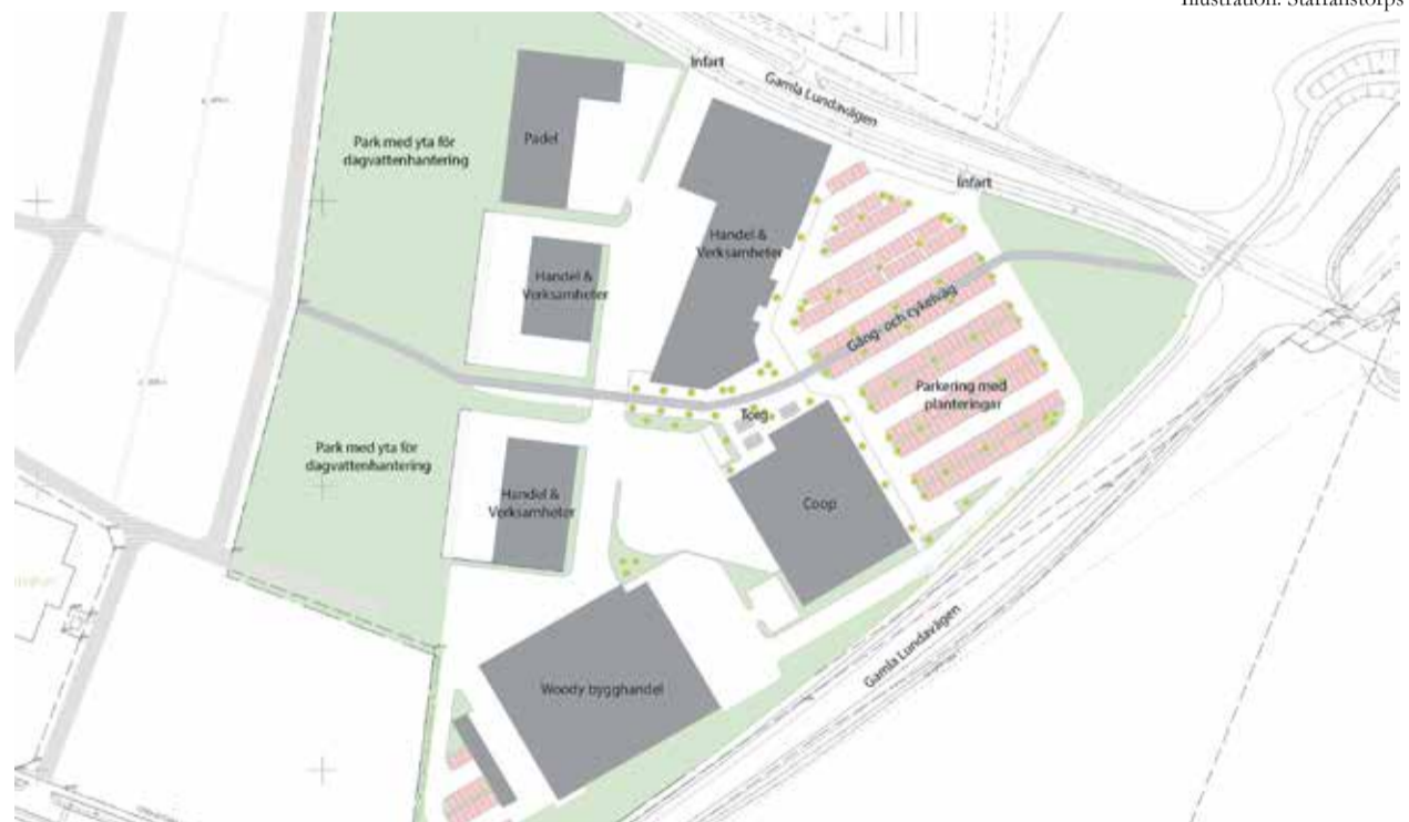
Så här kan det nya företagsområdet och serviceområdet i Hjärup komma att se ut när detaljplanen godkänns nästa år.