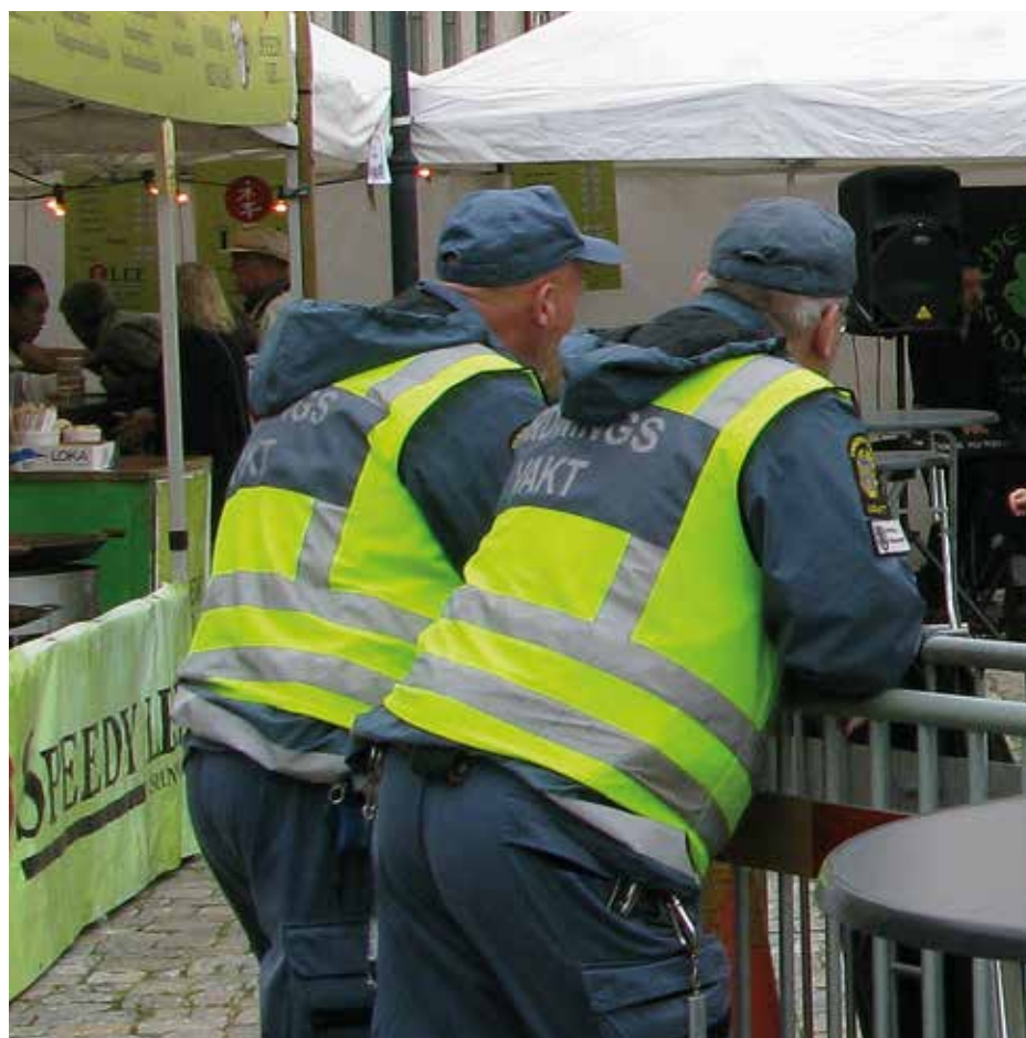
Staffanstorp har beslutat anställa egna ordningsvakter för att höja den dagliga tryggheten i kommunen. Även vid stora evenemang använder Staffanstorps kommun ordningsvakter för att höja tryggheten. Bilden är tagen vid en festival i Hjärup.

Polisen satte i december upp tillfälliga kameror vid torget i Staffanstorp och har nu fått tillstånd av länsstyrelsen att ha kvar dem till 2020. Tanken är att kamerorna ska ha en förebyggande effekt och ge ökad trygghet. Även bättre belysning planeras på vissa platser och grannsamverkansarbetet ska fortsätta utvecklas.