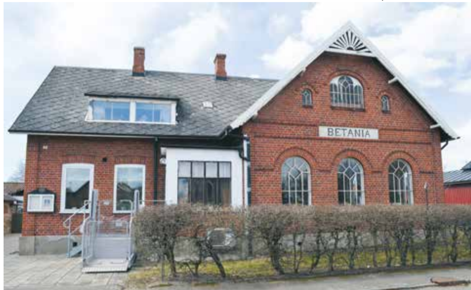
Betaniakyrkan är en karaktärsfull byggnad med drag från 1800-talets schweizerstil som omnämns i detalj i det nya kulturmiljöprogrammet.