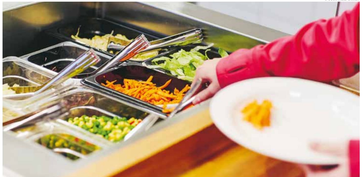
Måltiderna är en viktig och central del i livet för alla, både barn, vuxna och äldre, och en viktig källa till glädje, hälsa och social gemenskap, konstateras i Staffanstorps kommuns nya kostpolicy som antogs av kommunfullmäktige i mars.