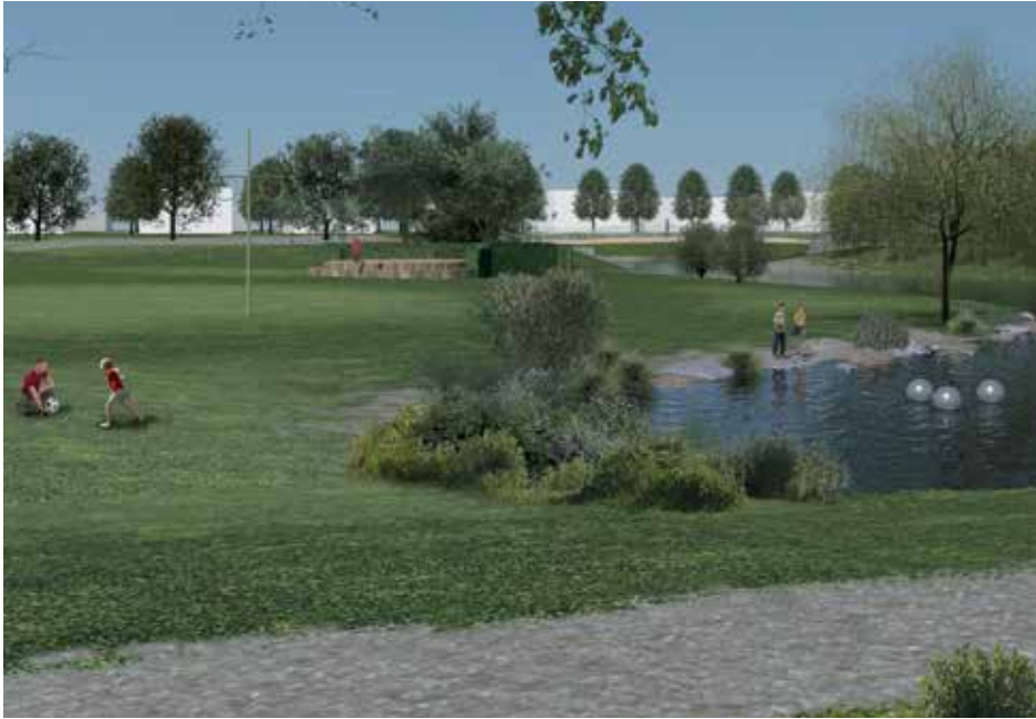
Illustration som visar framtida Hjärups park med damm, midsommaryta och friluftsscen.

legat till grund för gestaltningsarbetet av parken.