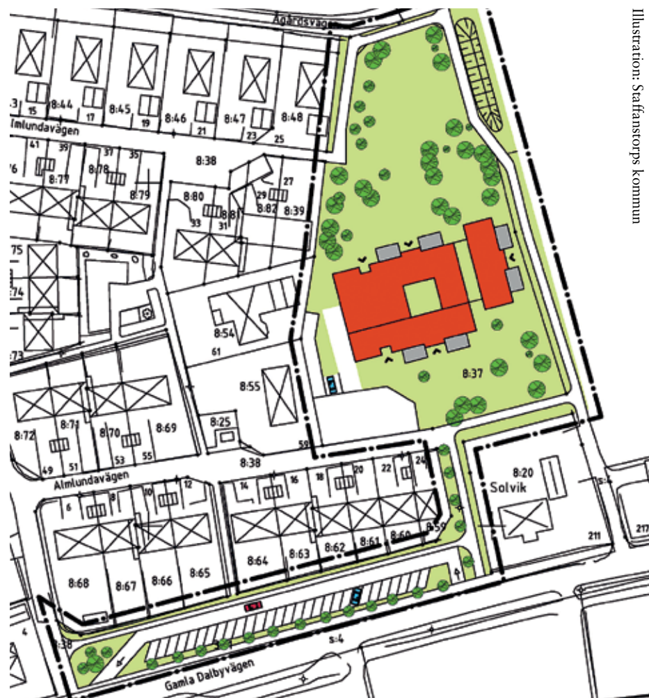
Illustration: Staffanstorps kommun

Almlunda gård kan spåras så långt tillbaka som till laga skiftet 1862 då det på platsen låg en gammal gård, Almlunda gård, som vid den tiden drevs av en lantbrukare Pär Persson. Den gamla gården har numera rivits för att ge plats åt den nya förskolan, men namnet bevaras.