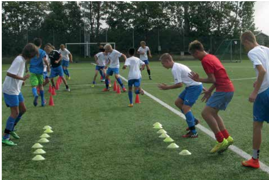
Fotbollselever från MFF-akademien tränar på Staffansvallen.