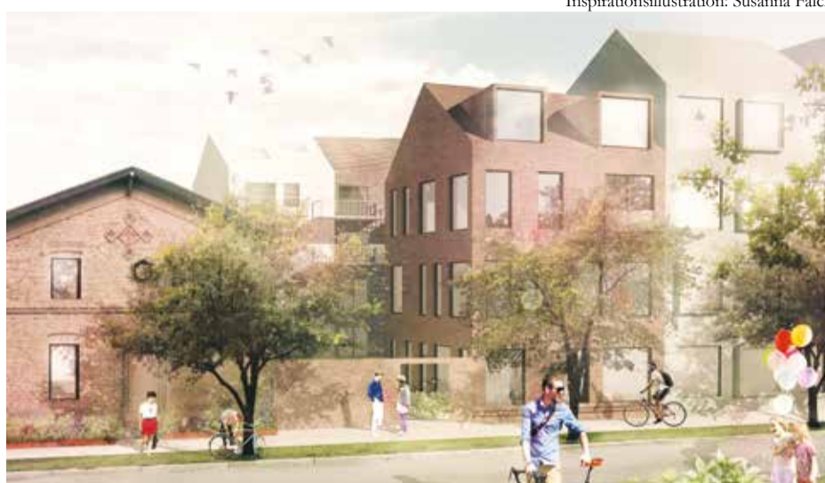
Kontoret omvandlat till bostäder i väst och med Dalbyvägen i förgrunden.

Detaljplanen för det första bygget har redan vunnit laga kraft. Just nu avslutas saneringsarbetet.