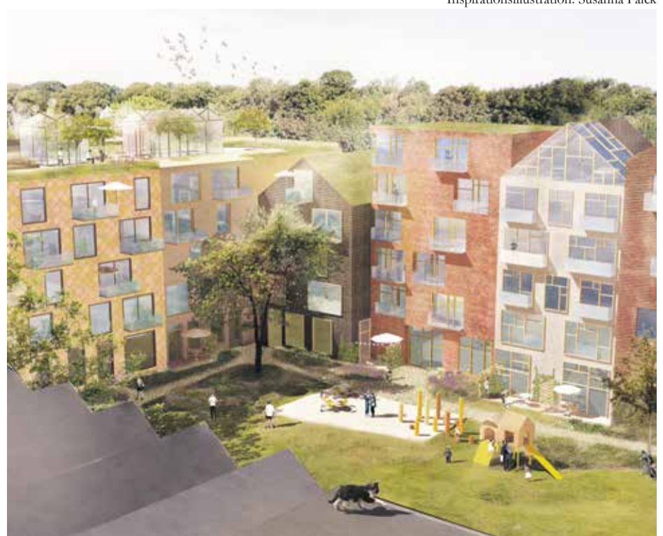
Sågtandshusens tak i förgrunden och Sockerbruksparken i bakgrunden.

– Sockertorget som blir stadsdelens viktigaste mötesplats ligger vid Betladan och Dalbyvägen, ett torg med sirliga träd i grupp som skapar rumslighet, säger Susanna Falck. Här ser vi också gärna en transparent glasbyggnad med någon slags serviceverksamhet som kan ”spilla” ut över torget. Anläggandet av Sockerstans paradgata, Sockerallén från Dalbyvägen upp genom Sockerstan förbi Sockerbruksparken ingår också i den första etappen.