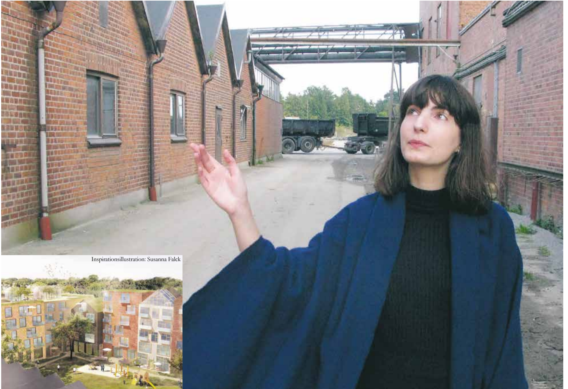
Inspirationsillustration: Susanna Falck