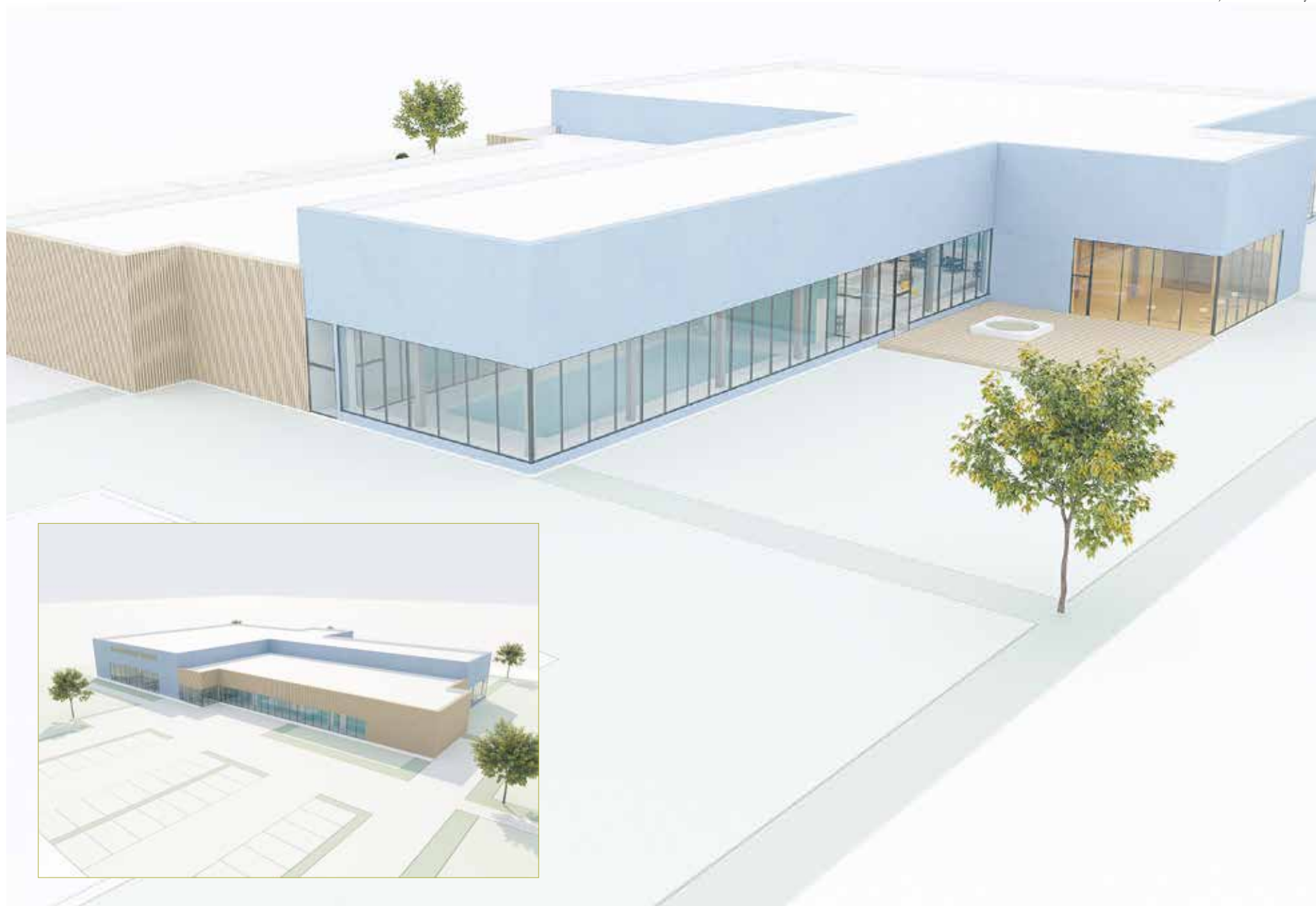
Illustration: Liljevalls arkitektbyrå