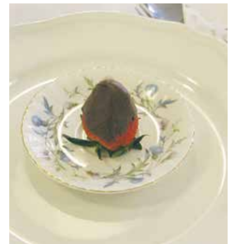
Dagens lunch vid besöket bestod av chokladdoppad jordgubbe, inbakad lax med romsås, sparris, soyaböner, kikärter och rucola samt bärpaj med vaniljsås.

– Vi uppmärksammar alla högtider som kan sammanfalla med mat. Idag firar vi våren, på söndag är det våffeldagen. Man hittar alltid anledningar att fira litet!