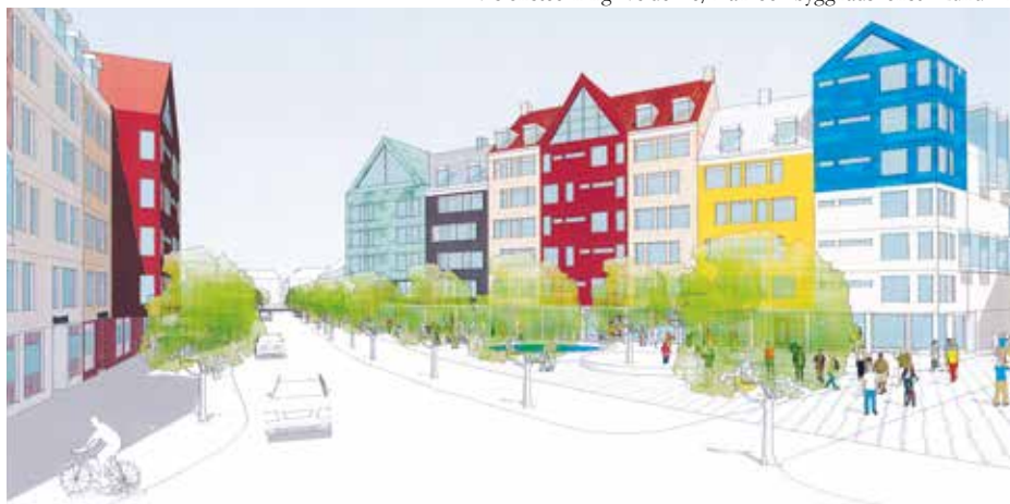
Så här kan Södra Stanstadsområdet se ut om tre-fyra år.

Projektet knyter samman centrum i ett förtättningsprojekt där dagens öppna ytor och låga bebyggelse ska ge utrymme för fastigheter på mellan fyra och åtta våningar. Området ses även som en förlängning av Storgatan vilket innebär att det ska beredas plats för butiksytor i bottenplanet.