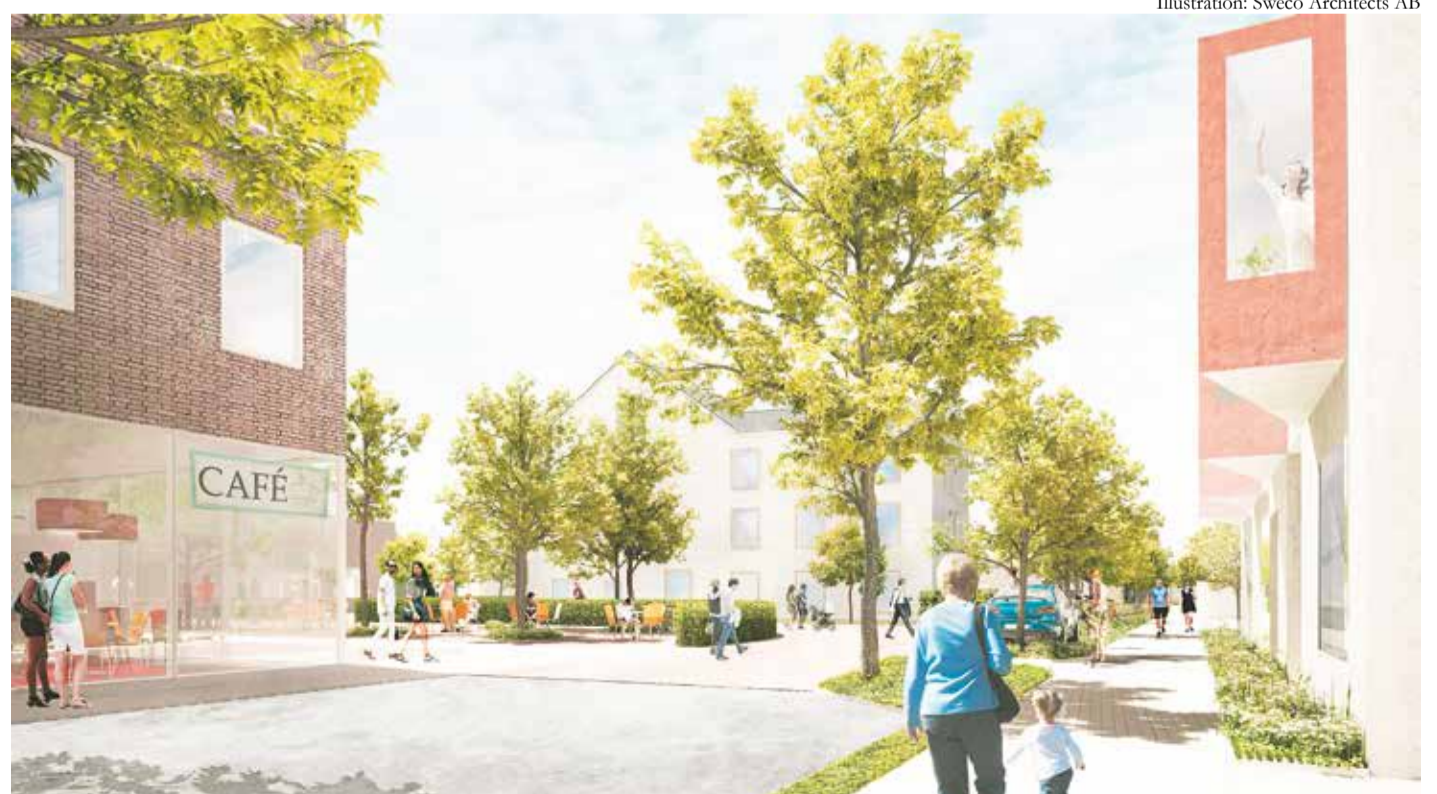
Illustration: Sweco Architects AB

Vikhem V. Östra och sista delen. Detaljplan på samråd 19 november till 16 december. Cirka 150 lägenheter, småhus samt förskola, f-9-skola och stor idrottshall planeras.