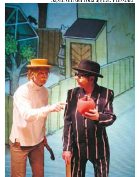
Sagan om det röda äpplet. Pressbild.

Arr. Biblioteken i Staffanstorps kommun & Staffanstorps teaterförening.