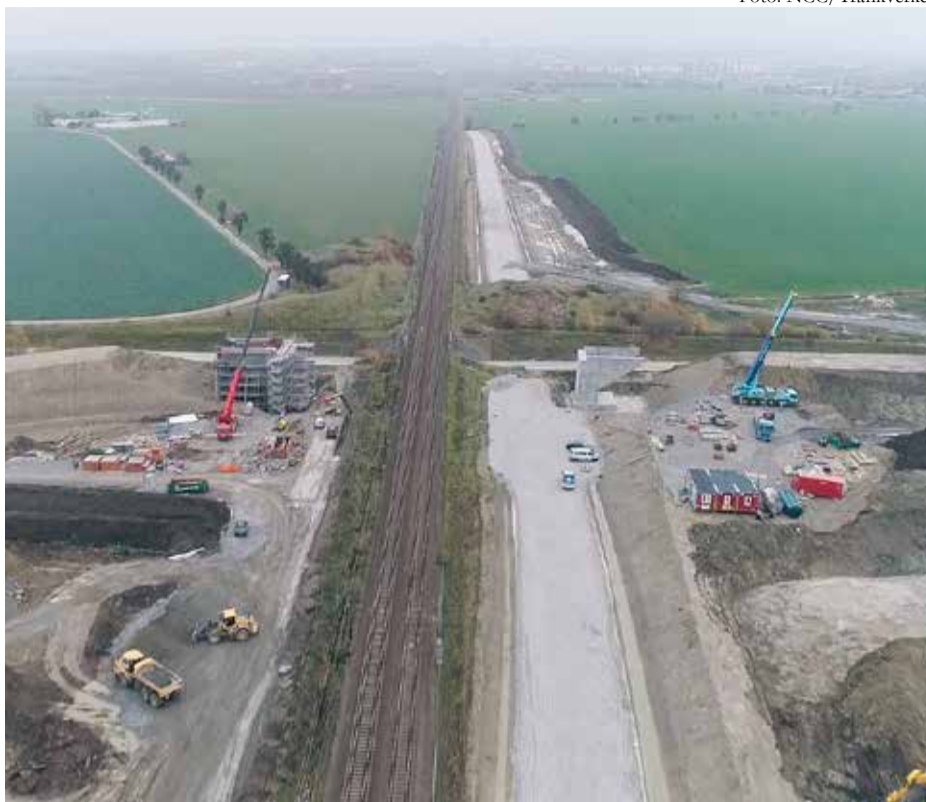
Bilden visar arbetet med fyra spår-projektet vid Vragerupsvägen i mitten av november.

– Vi måste byta ut alla ledningar mellan östra och västra Hjärup för el, vatten, avlopp, dränering