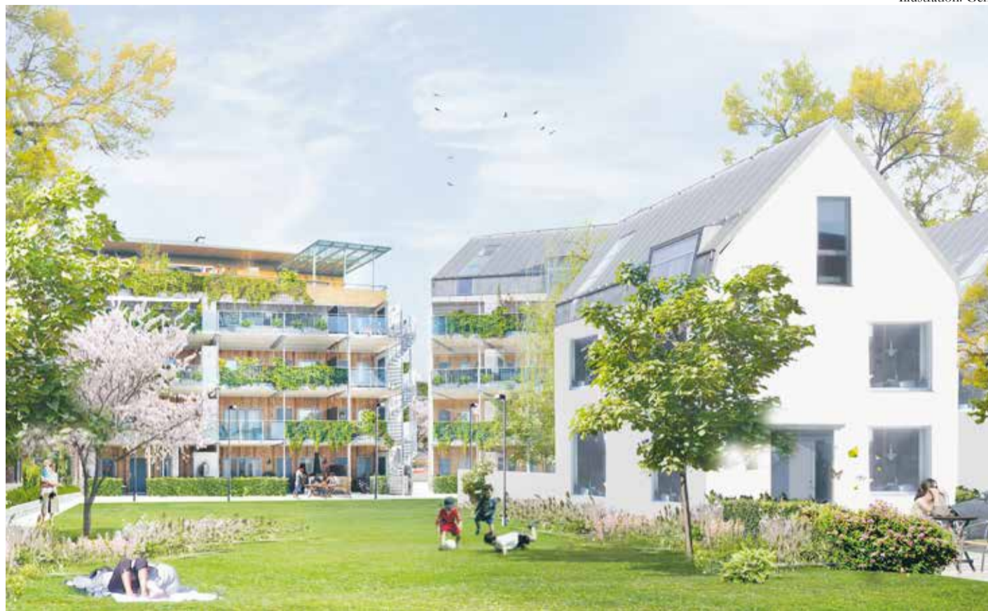
Visionsteckning av nya stadsdelen Västerstad i Hjärup som med fokus på samhällsutveckling och hållbarhet nu börjar växa fram på ritbordet. Illustration från planprogrammet 2015.

– Vårt fokus ligger på samhällsutveckling och hållbarhet. Det är viktigt för oss att berika Hjärup