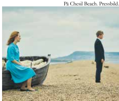
På Chesil Beach. Pressbild.