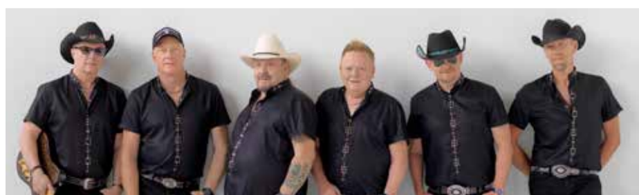
Lasse Stefanz, ett av årets stora dragplåster på Dansfestivalen.