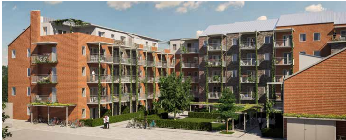
I Brf Sockerstan planeras ett 60-tal bostadsrätter och alldeles intill i Kontoret 17 hyresrätter.

- Vi jobbar nu även med detaljgestaltningen av Sockertorget som ska bli ett levande torg med lokaler för affärer och verksamheter samt busshållplats. Här ingår den gamla betladan som är tänkt att bli saluhall med mattema; försäljning, servering och matproduktion. Det är ett önskemål från politiken eftersom vi är