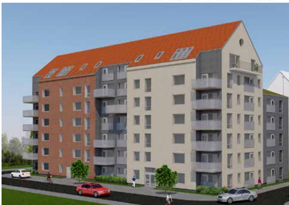
Leny Fastighets AB planerar 48 hyresrättslägenheter i ett sjuvåningshus intill vårdboendet i Sockerstan