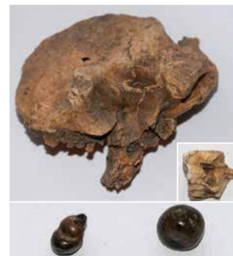
Skolbarn på arkeologiskolan i Uppåkra gjorde i höstas egna spännande fynd som anknyter till platsens historia, bl a ett skalltak och en tand från människor samt en "smälta" som kan härröra från glasproduktion.