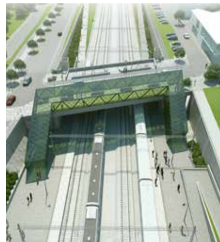
Sommaren 2024 ska 4-spårutbyggnaden vara klar ända till Flackarp.

Om fem år, sommaren 2024, beräknas 4-spårutbyggnaden vara klar fram till Flackarp och de nya spåren vara i drift fyra meter ner i marken genom Hjärup, med ny station och tre nya broar över spåren vid Lommavägen, Hjärups station och Vragersvägen.