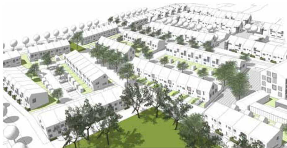
Ett nytt stadscentrum planeras i anslutning till Hjärups nya station. Illustration: Arkitektbolaget

- Vi planerar därför stadsmässiga kvarter i anslutning till stationsbron där vi tänker oss den form av service som man kan förvänta sig av ett samhälle som är så stort som Hjärup är på väg att blir. Vi styr inte verksamheterna som ska etableras, men här skulle kunna finnas en större livsmedelsbutik samt i de mindre lokalerna kanske frisör, mindre restauranger och liknande.