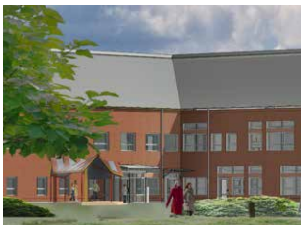
Illustration: Wigot konsult AB

Alina och Simon går på gymnasieskolor i Lund och Malmö. Båda är jättenöjda med hur deras högstadieskola i Staffanstorps förberett dem för gymnasiet. → 3