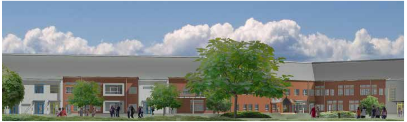
Så här kommer Gullåkraskolan att se ut när den invigs om knappt två år. Illustration: Wigot konsult AB

Vårterminen 2022, om knappt två år, kan 550 elever äntligen flytta från Borggårdsskolan samt de provisoriska lokalerna i gamla Bråhögsskolan till Gullåkraskolan, en ny supermodern skola i norra Staffanstorp, byggd med stor pedagogisk omsorg och inspiration hämtad bland annat från Uppåkra arkeologiska center.