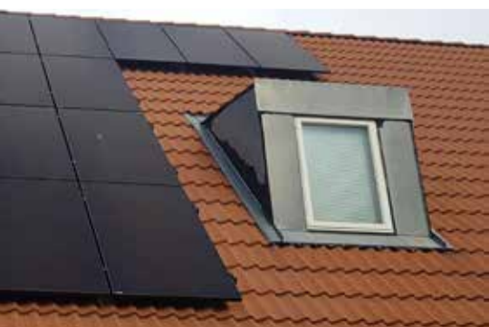
tak i Hjärup har gett ett elöverskott i vinter.

Vill du också ha kontakt med energirådgivarna? De nås enklast genom en e-tjänst på kommunens webbsida staffanstorp.se (skriv ”energirådgivning i sökrutan”) men även via epost energirad@staffanstorp.se eller via webbsidan ekrs.se/staffanstorp