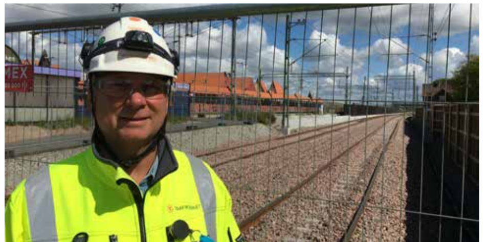
- Mellan 22 och 28 augusti stoppas all tågtrafik mellan Malmö och Lund då de tillfälliga spåren ska tas i bruk, berättar biträdande projektledare Petter Holmqvist vid Trafikverket.

En tillfällig station upprättas i Hjärup och för att den ska kunna nås skapas en tillfällig gångpassage söderut intill stationsbrons nya betongfundament.