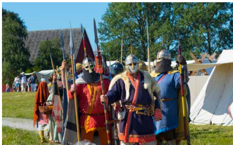
Uppåkra arkeologiska center planerar för en modifierad version av Vendeltidsdagarna i höst.

Aktuell information om öppettider, visningar med mera återfinns på uppakra.se