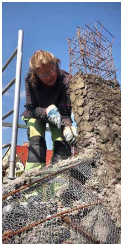
I Järrestad på Österlen växer den skulptur med fornnordiskt motiv fram som snart ska smycka nya Hjärups park.

- Detta är den första skulptur som sätts upp i vår kommun på många